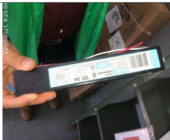
Foto 2. Ausencia de etiquetado y empaclado de residuos de aparatos eléctricos y electrónicos, en el centro de acopio ubicado en área de Casa Vieja.